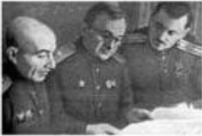
Авторы гимна СССР (слева направо): писатель Г.А. Эль-Регистан, композитор А.В. Александров и поэт С.В. Михалков