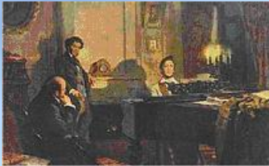
А.С. Пушкин и В.А. Жуковский у М.И. Глинки Художник В. Артамонов

В отличие от гербов и флагов, которые были символами государств ещё в глубокой древности, гимны, как государственные символы. Появились сравнительно недавно.