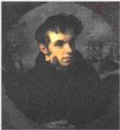
Василий Жуковский Гравюра с портрета Кипренского

Первым официальным государственным гимном России можно считать гимн, написанный в 1815 году поэтом Василием Жуковским на музыку британского гимна. Российский император Александр Первый в 1816 году одобрил стихи написанные Жуковским и повелел всегда исполнять этот гимн во время встреч императора.