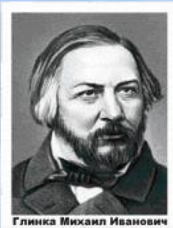
Глинка Михаил Иванович

1833 год. Новая мелодия и новые слова в гимне «Боже царя храни».