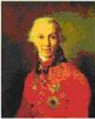
Гавриил Державин Художник В.Боровиковский 1811 г.

Первым гимном России (правда, неофициальным) можно считать марш «Гром победы раздавайся». Этот марш в 1790 г. был написан поэтом Гаврилой Державиным и композитором Иосифом Козловским в честь героического взятия русскими войсками (под командованием великого полководца Александра Суворова) неприступной турецкой крепости Измаил.