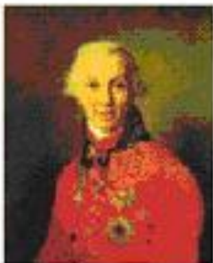
Гавриил Державин Художник В.Боровиковский 1811 г.

Первым гимном России (правда, неофициальным) можно считать марш «Гром победы раздавайся». Этот марш в 1790 г. был написан поэтом Гаврилой Державиным и композитором Иосифом Козловским в честь героического взятия русскими войсками (под командованием великого полководца Александра Суворова) неприступной турецкой крепости Измаил.