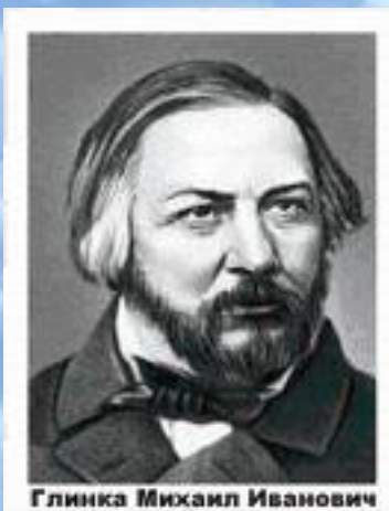
Глинка Михаил Иванович

1833 год. Новая мелодия и новые слова в гимне «Боже царя храни».