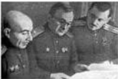
Авторы гимна СССР (слева направо): писатель Г.А. Эль-Регистан, композитор А.В. Александров и поэт С.В. Михалков