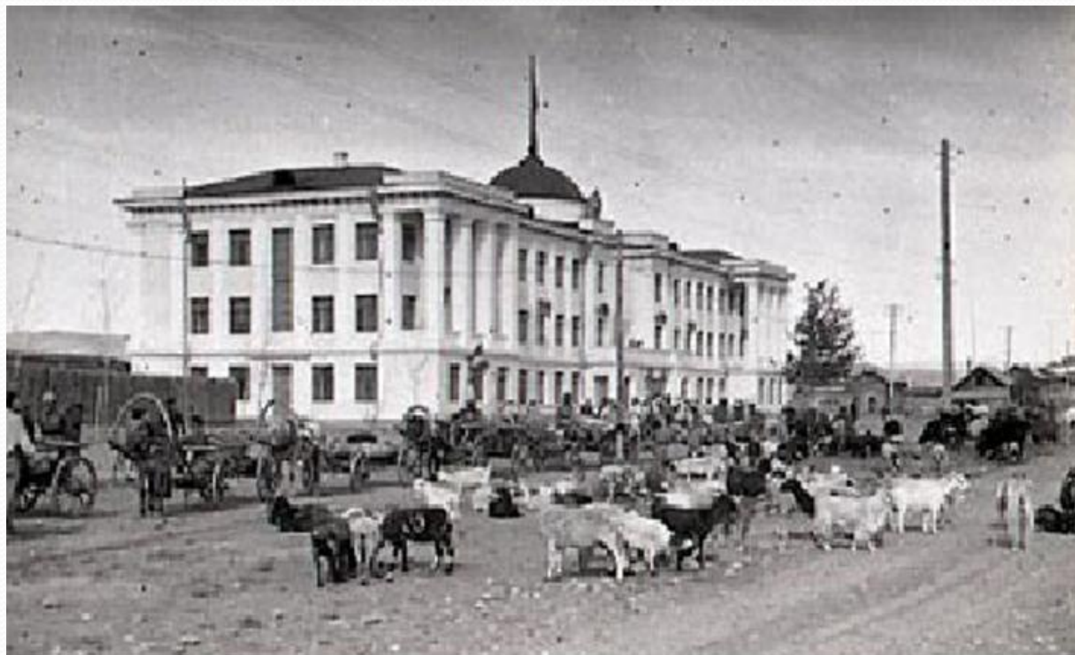
1. Здание Правительства ТНР, 1943 г.