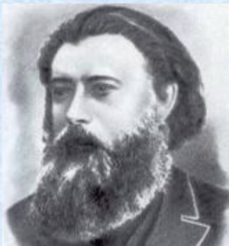
Яблочков П.Н. 1847-1896