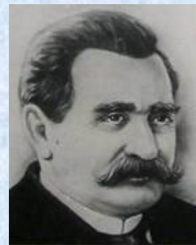
Лодыгин А.Н. 1847-1923