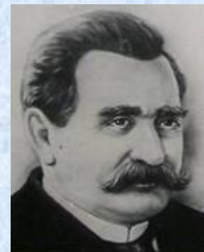
Лодыгин А.Н. 1847-1923