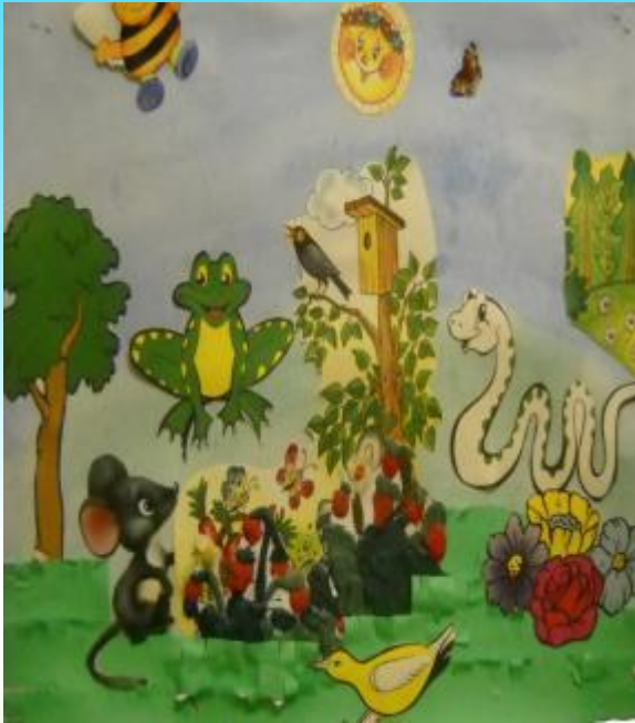
афиша виде коллажа