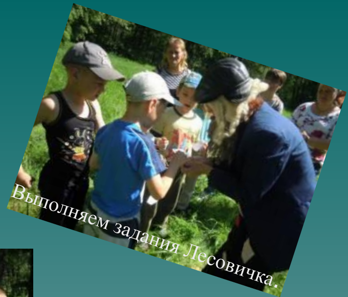
Выполняем задания Лесовичка.