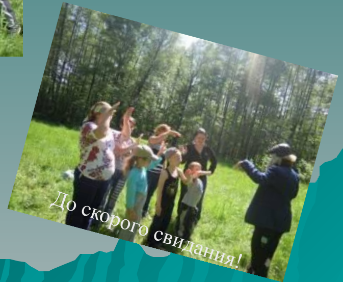
До скорого свидания!