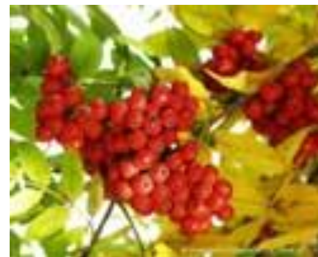
Рябина с плодами