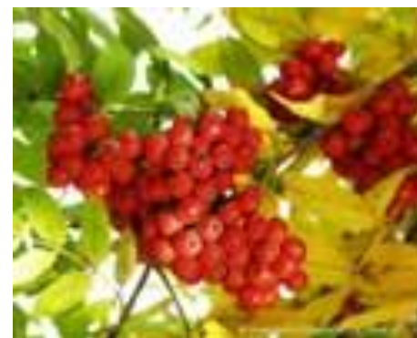
Рябина с плодами