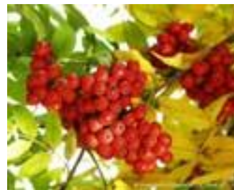
Рябина с плодами