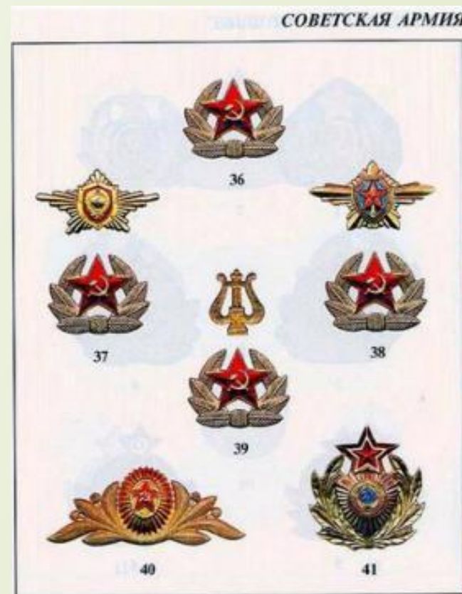
36. Старшины, сержанты, солдаты, курсанты, 1969. 37-38. Сержантский и рядовой состав роты Почетного караула, 1969. 39. Сержантский и рядовой состав сводного Военного оркестра, 1969. 40. Маршалы родов войск и генералы (повседневная форма), 1988. 41. Офицеры, прапорщики, военнослужащие сверхсрочной службы (проектный образец), 1990.

Историки не могут однозначно указать дату, когда кокарда стала использоваться в царской России. Существует несколько предположений. Однако самой распространенной датой считается 1724 год. Наша же кокарда современная-ей не более пятидесяти лет. Такие кокарды стали украшать шапки советских солдат с 1969 года. Появление подобной находки на нашем участке я могу объяснить тем, что в одном километре от нашей дачи раньше располагалась пограничная застава, но на сегодняшний день пограничный отряд расформирован