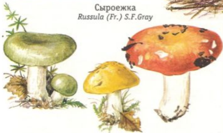
Сыроежка Russula (Fr.) S.F.Gray