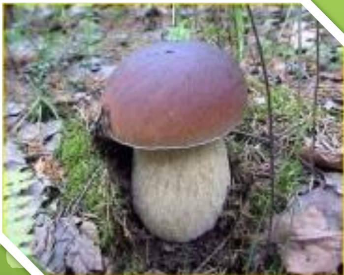
Белый гриб еловый