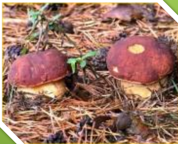
Белый гриб сосновый