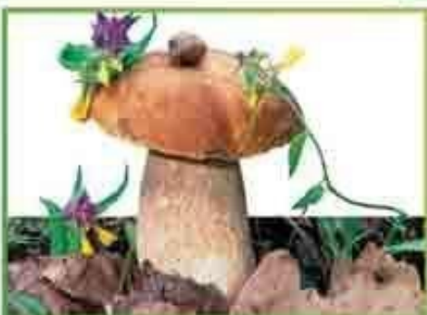
белый гриб (еловый)