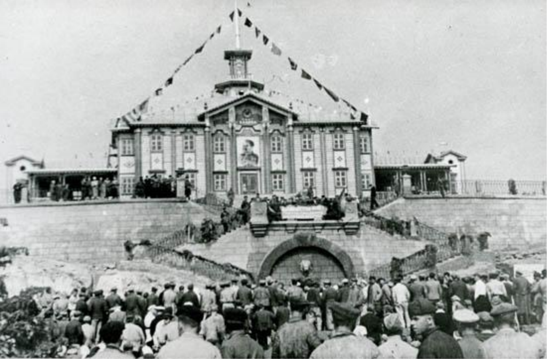
МИТИНГ, ПОСВЯЩЕННЫЙ ОТКРЫТИЮ СКВОЗНОГО ДВИЖЕНИЯ Комсомольск - бухта Ванна. 1945