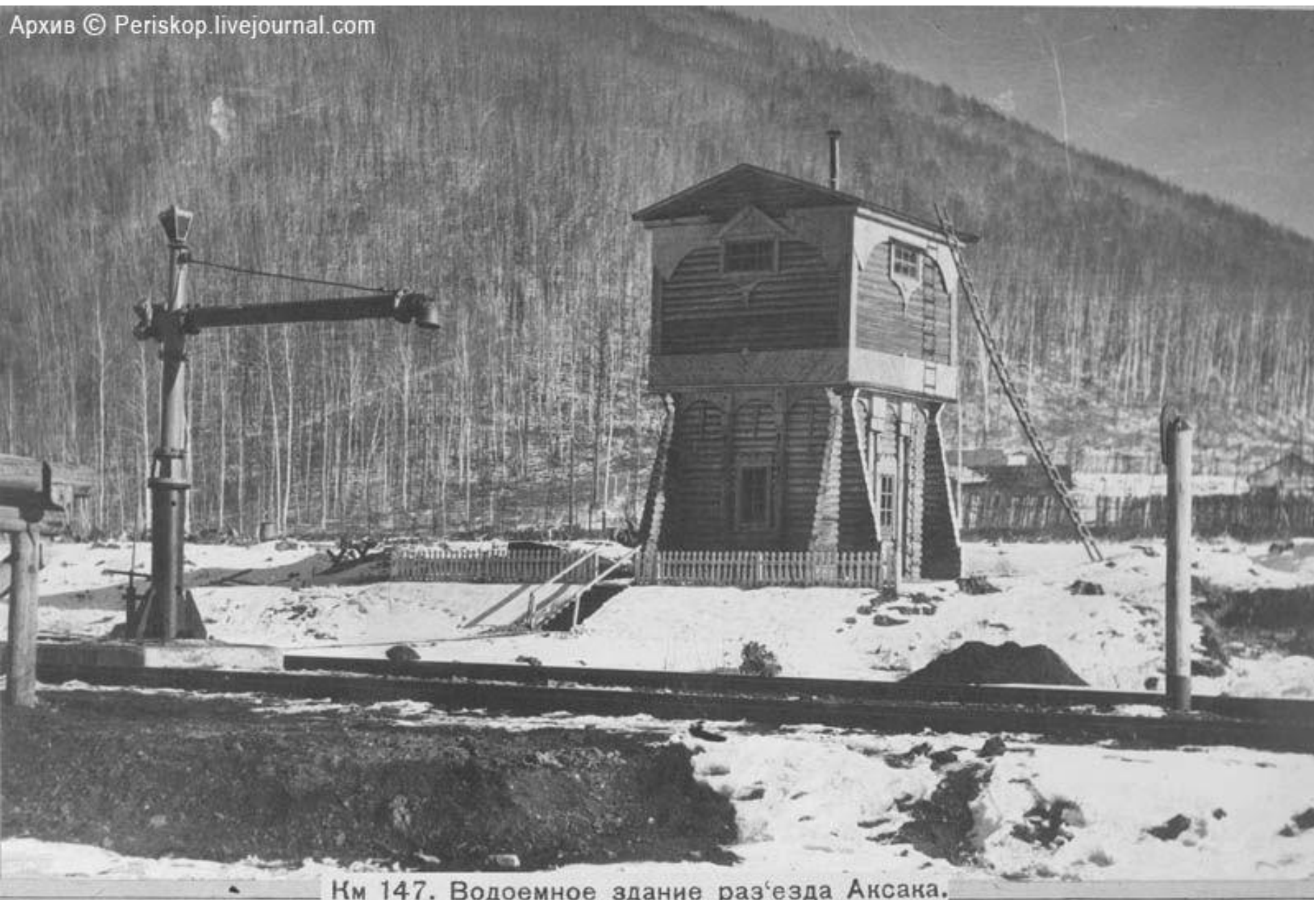
Км 147. Водоемное здание разъезда Аксака.