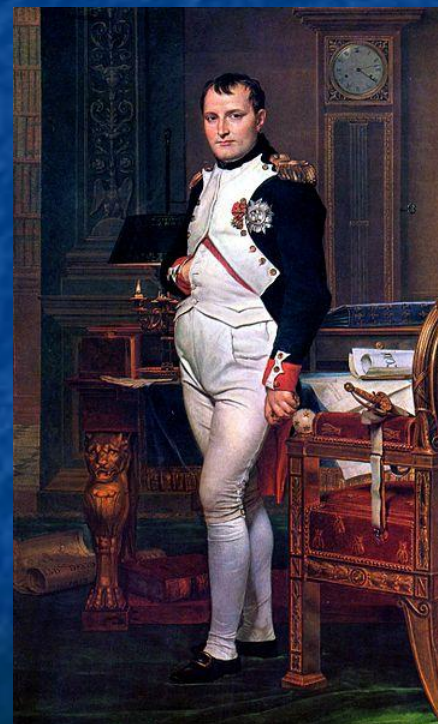
Император Наполеон I