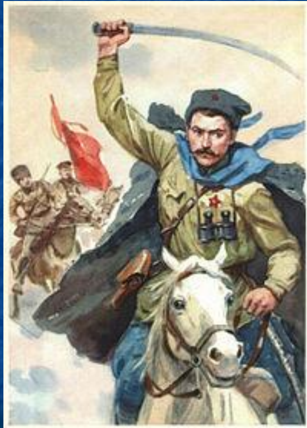
Герой Гражданской войны В. Чапаев

Основная борьба за власть в период Гражданской войны велась между большевиками с Красной армией («красными»), с одной стороны, и «белыми» (офицерством, казачеством, интеллигенцией, помещиками, буржуазией), с другой.