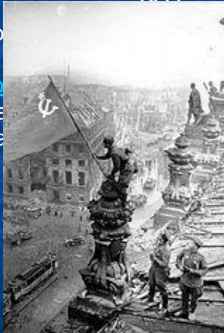
Знамя Победы над рейхстагом

Договор о ненападении между Германией и Советским Союзом. Советским войскам удалось остановить её вторжение к концу осени 1941г. и перейти с декабря 1941г. в контрнаступление. В период с 1944г. по май 1945г. советские войска освободили всю территорию СССР, а также подписанием Акта о безоговорочной капитуляции Германии. Война привела к победе на Советского Союза, привела к большому ущербу всему населению и разрушению части промышленности.