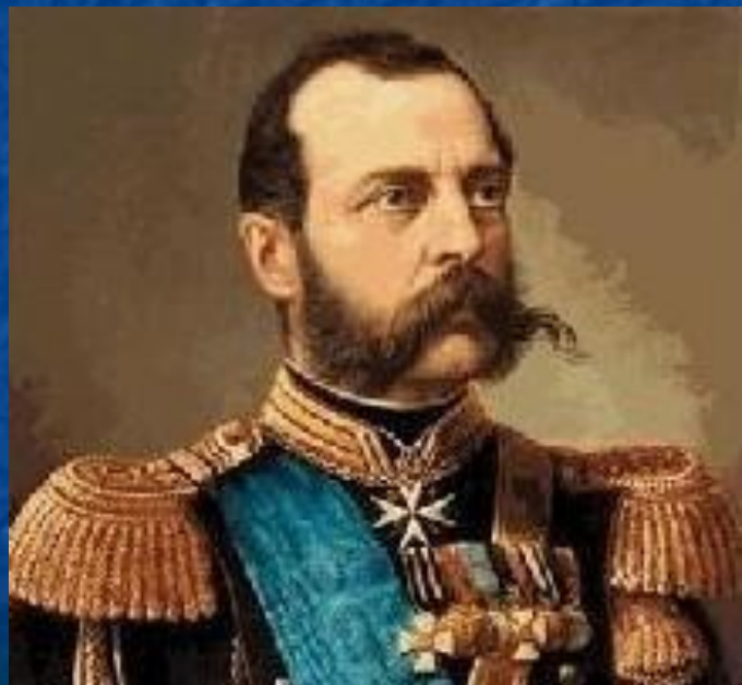
Царь Александр II