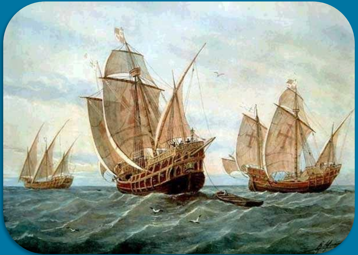
Каравеллы «Нинья», «Пинта» и «Санта- Мария»

Три каравеллы «Нинья», «Пинта» и флагман «Санта- Мария» взяли курс на Канарские о-ва