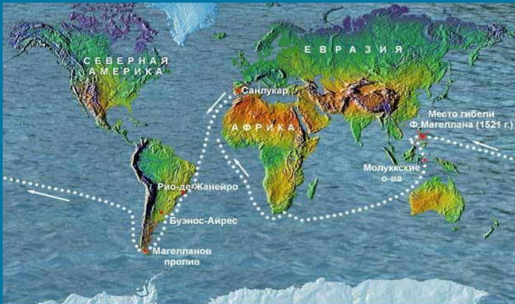
Первая кругосветная экспедиция Ф. Магеллана. 1519-1522 гг.