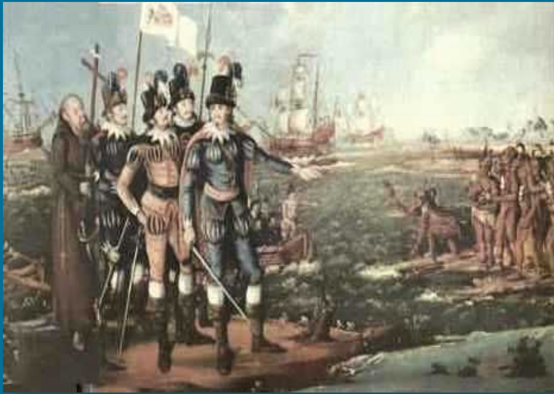
Высадка Колумба на открытом им острове

Открыли о. Сан-Сальвадор, Гаити, Куба и др. о-ва Карибского моря. Но Колумб думал, что это Индия, и называл местных жителей индейцами.