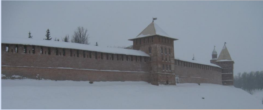
Детинец, вид с Софийской стороны

Новгородский Кремль, или Детинец, как его называли в Новгороде в древности, заложенный князем Ярославом, - древнейший из сохранившихся в России Кремлей (впервые упоминается в летописи 1044 г.). Следов этой постройки до нас не дошло, в последующие годы новгородский Детинец неоднократно перестраивался. Однако нет сомнений в том, что первая каменная новгородская крепость находилась на том же месте, где расположен сохранившийся донныне Детинец.