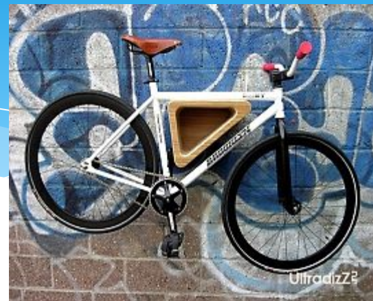
Стойка для велосипеда