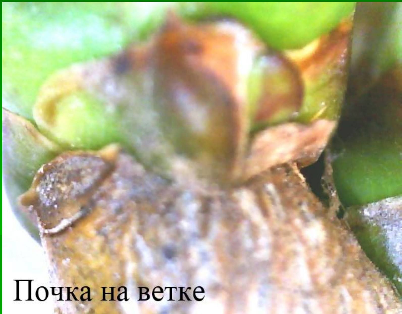
Почка на ветке