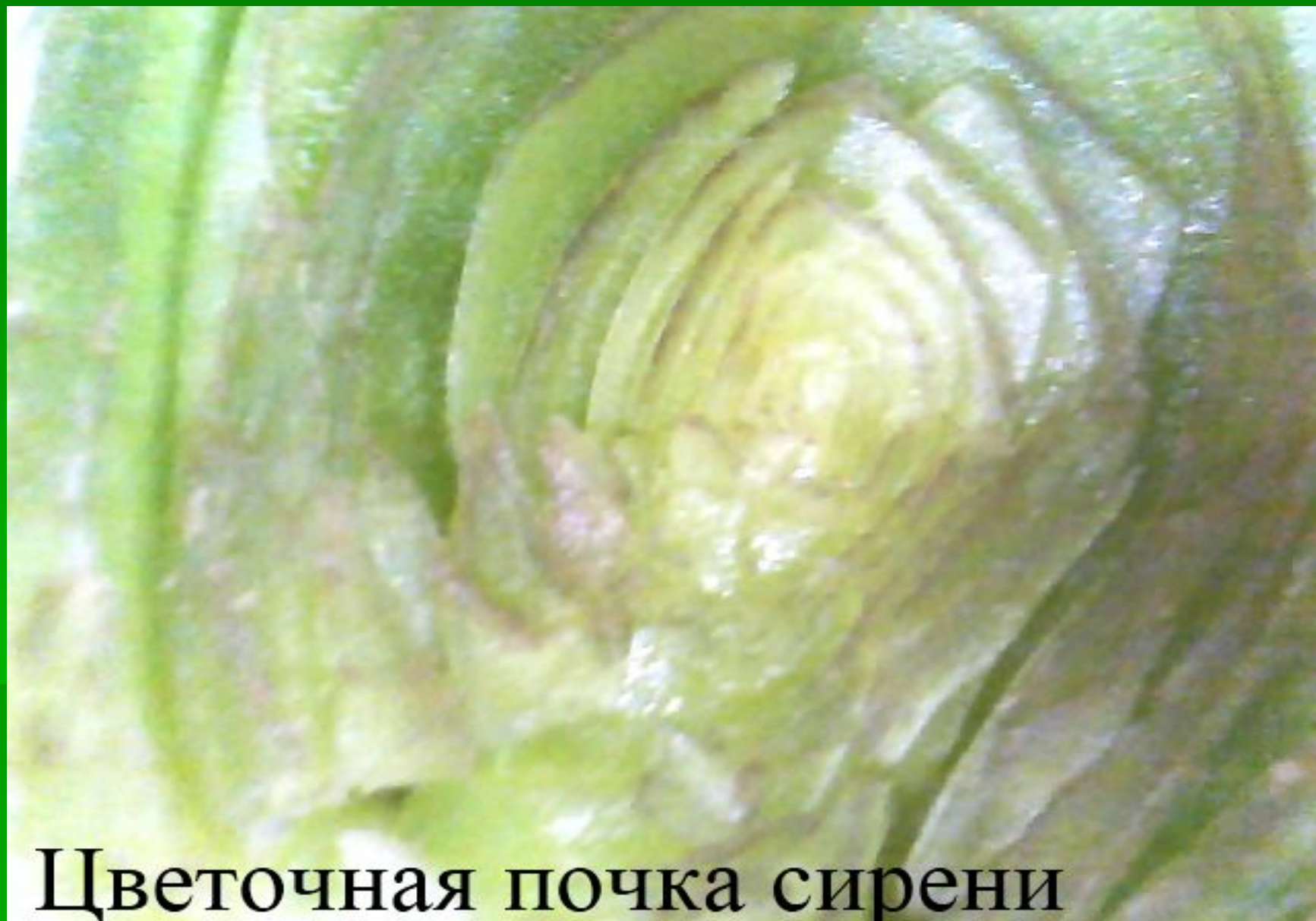
Цветочная почка сирени