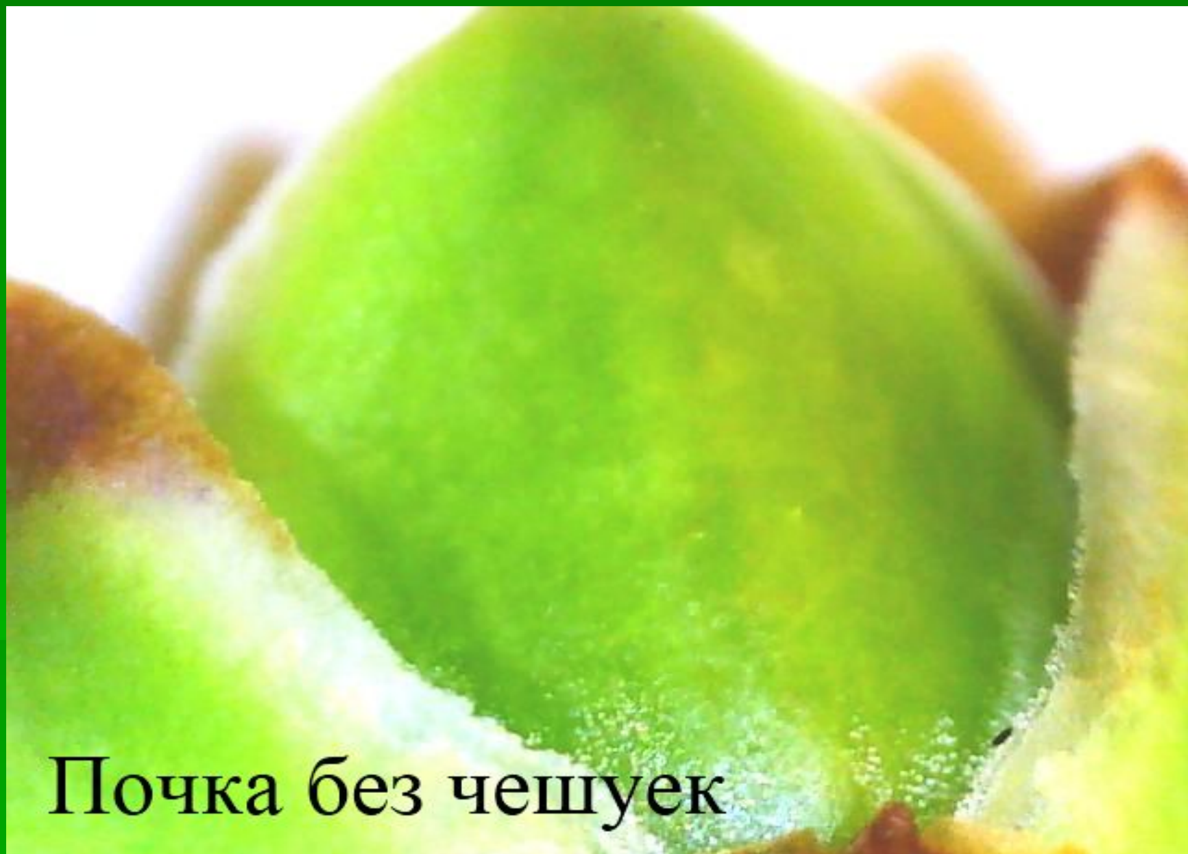
Почка без чешуек