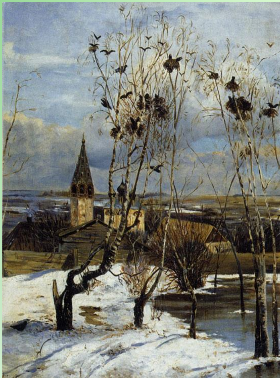
А.К. Саврасов «Грачи прилетели»