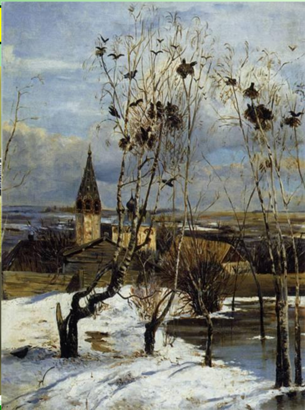
А.К. Саврасов «Грачи прилетели»