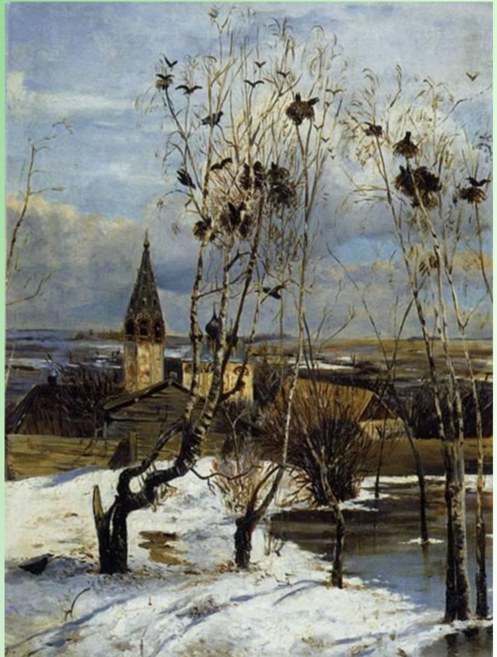
А.К. Саврасов «Грачи прилетели»