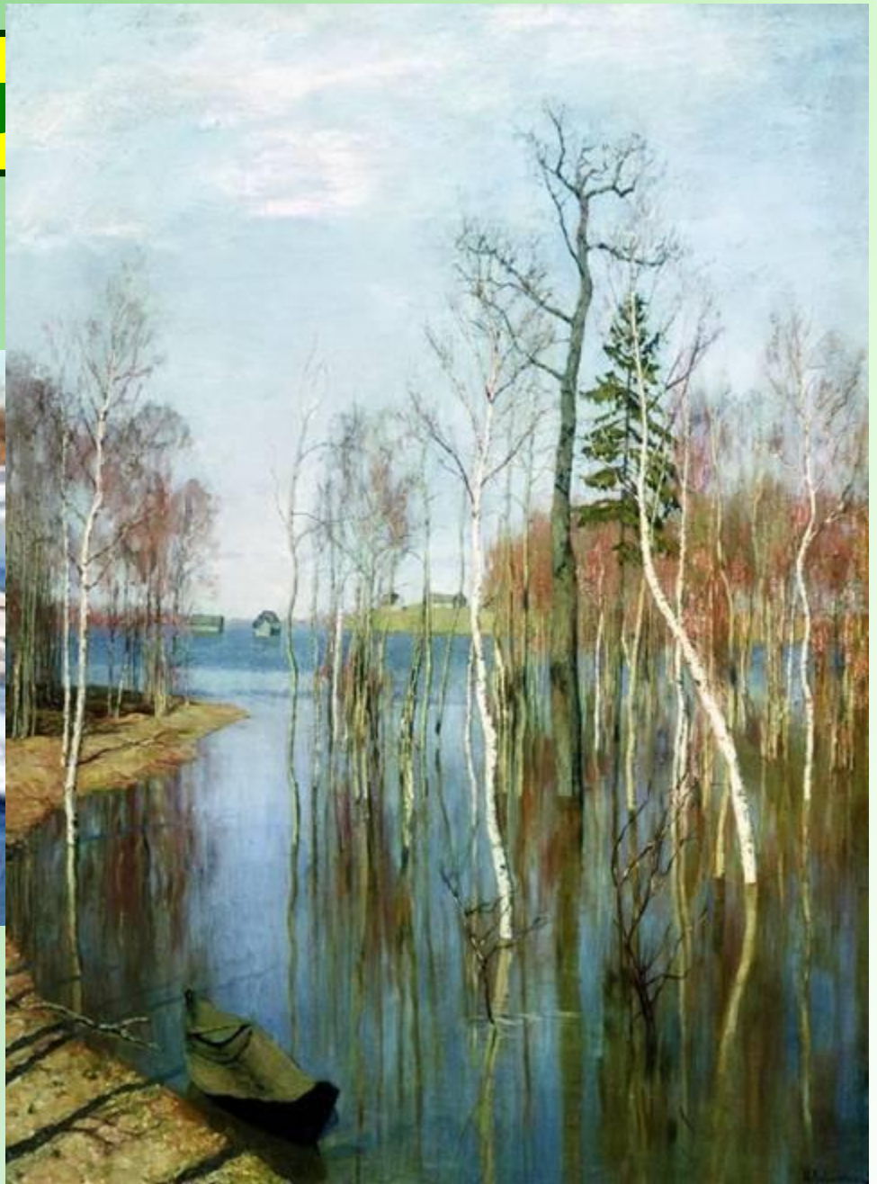
И.Левитан. Весна. Большая вода