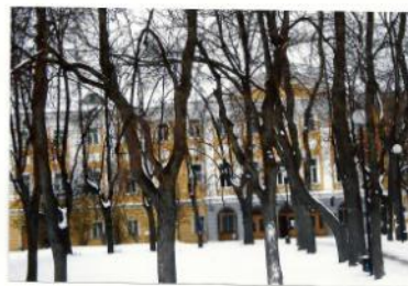
Музей декоративно-прикладного и народного искусства.