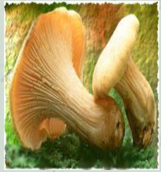
Ядовитый гриб – Ложный опенок