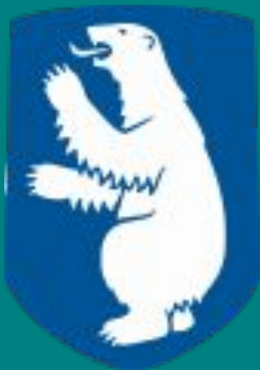
герб Гренландии (Дания)