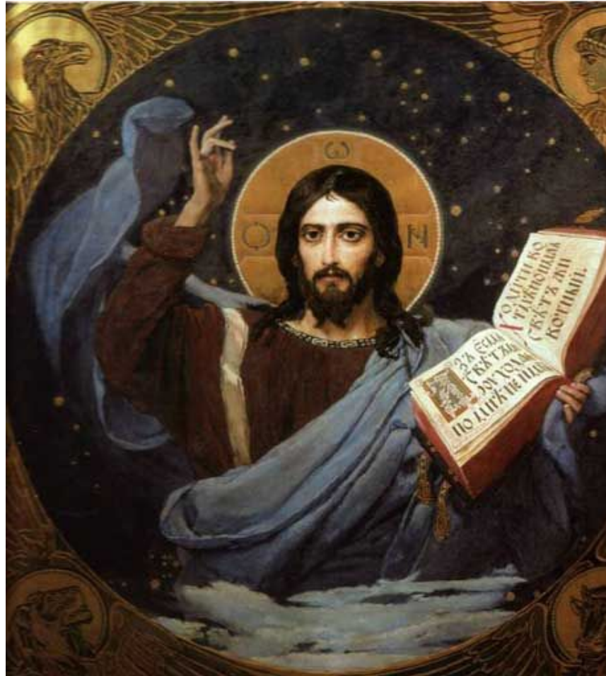
Христос Вседержитель (плафон главного купола Владимирского собора в Киеве), 1095-1096