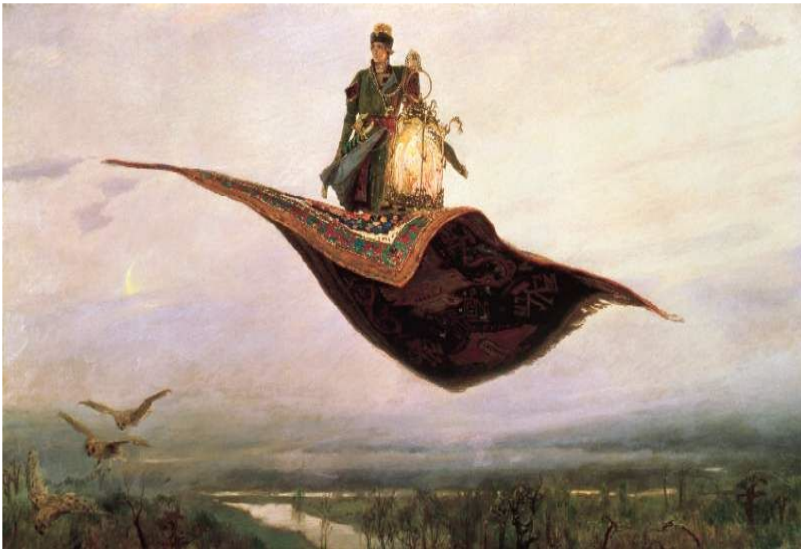
Картина «Ковёр-самолёт». 1880