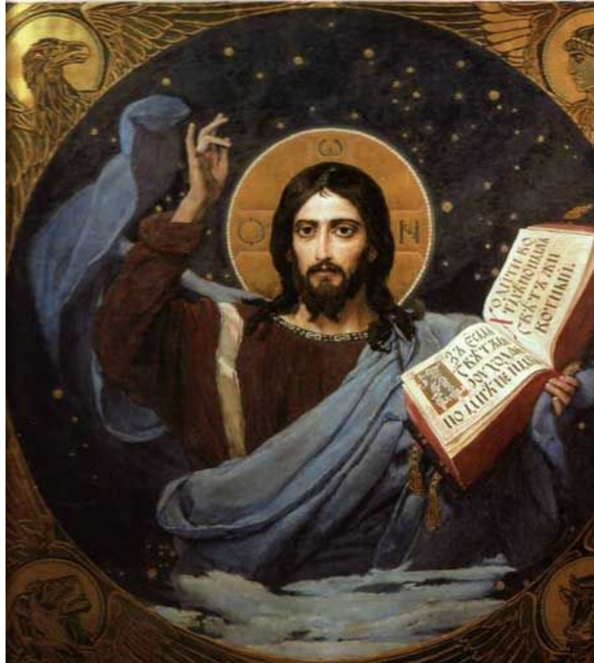
Христос Вседержитель (плафон главного купола Владимирского собора в Киеве), 1895-1896