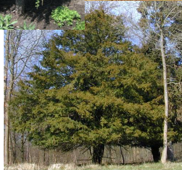
Тис ягодный (более 200 лет) - Taxus baccata