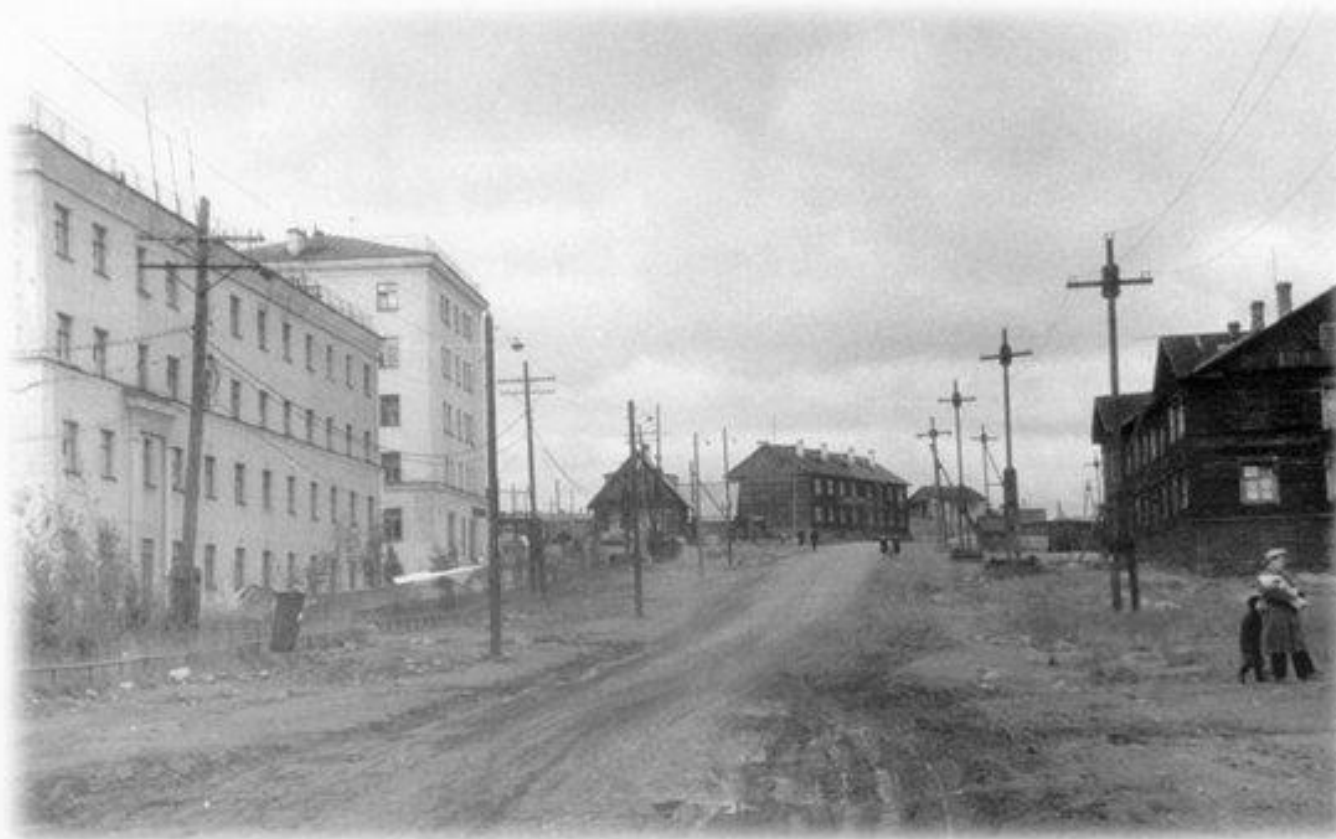
Улица Митякина (нынешняя ул. Коллариуса Зерин), 60-е годы.