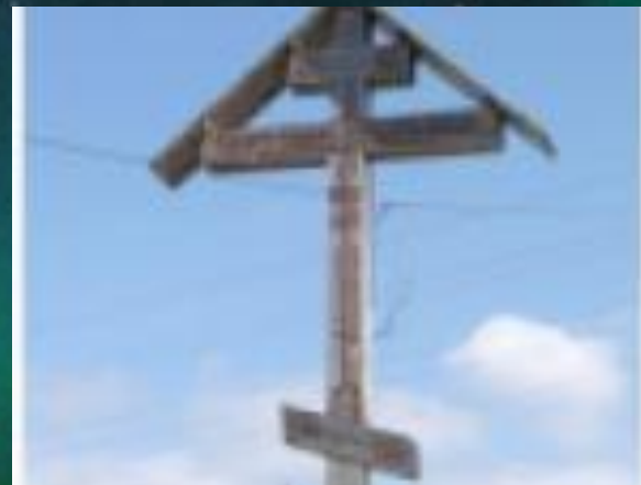
Деревянный крест, которому поклонялись моряки