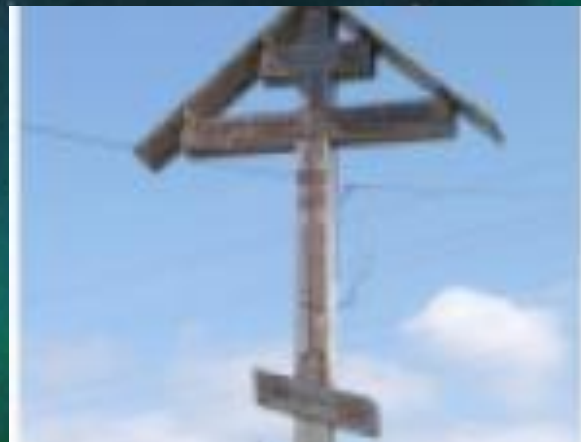
Деревянный крест, которому поклонялись моряки