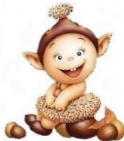
Сказки о чаккли

Это чаккли – маленькие, голые люди, которые живут под землёй.