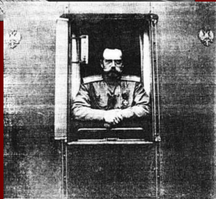
Государь Император Николай II после отречения.