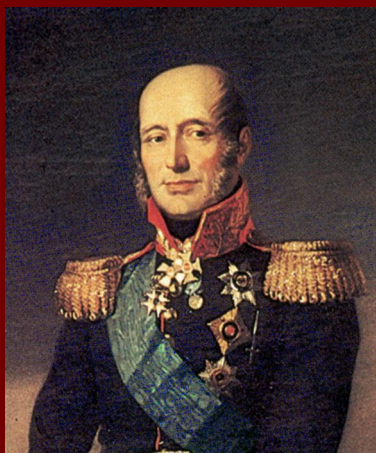
Барклай – де - Толли