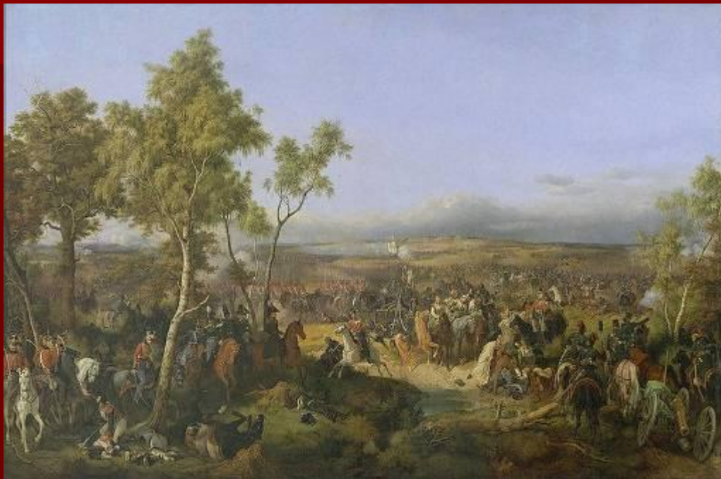
Битва под Тарутино