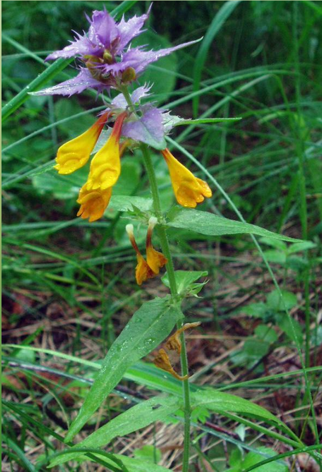
Иван–да–марья (марьянник дубравный)