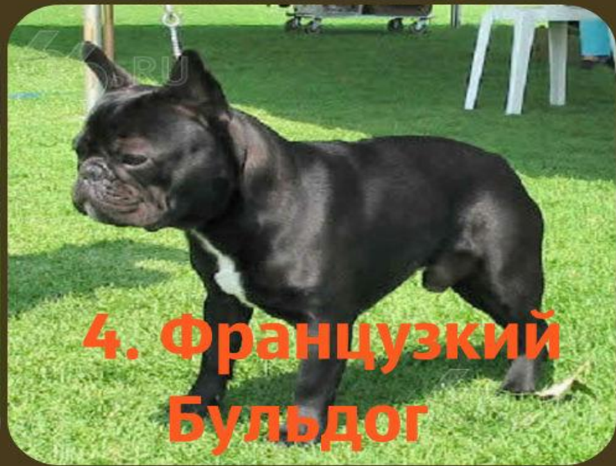
4. Французский Бульдог