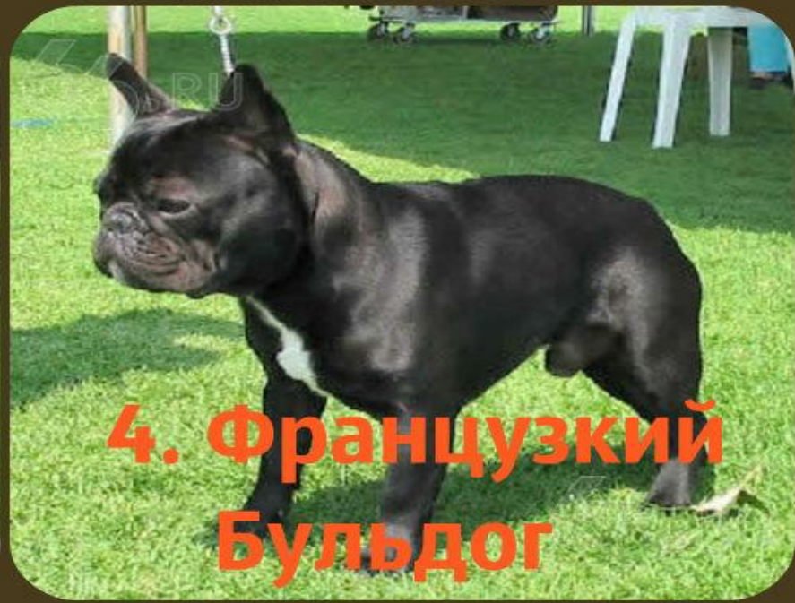
4. Французский Бульдог