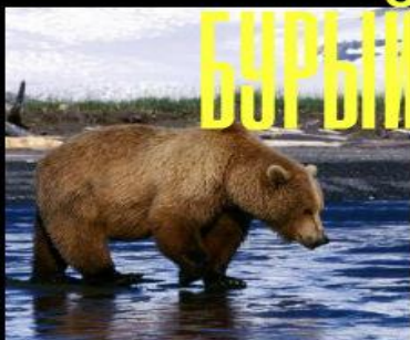
БУРЫЙ МЕДВЕДЬ 6