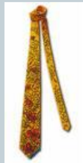
Галстук - самовяз