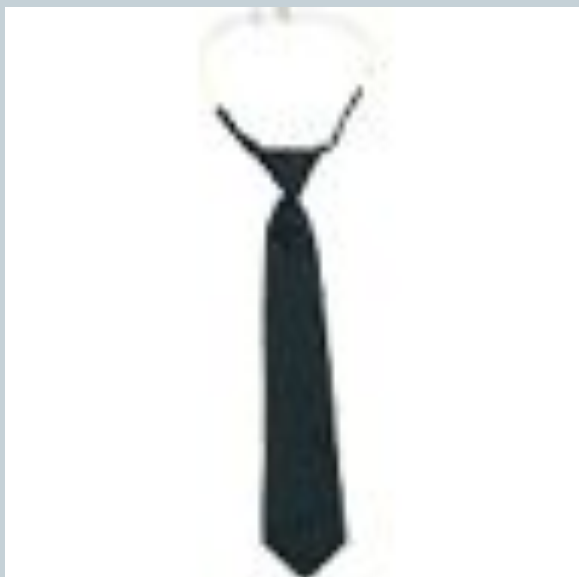
Галстук - регат