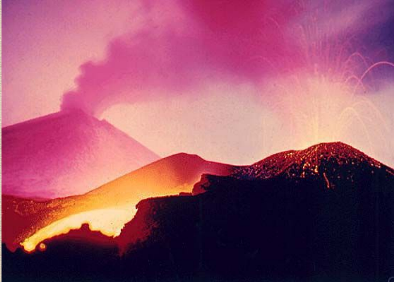
Трещинное извержение вулкана Толбачек на Камчатке