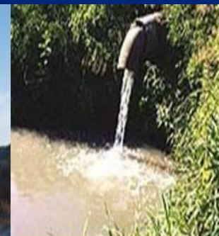
Сток промышленных отходов