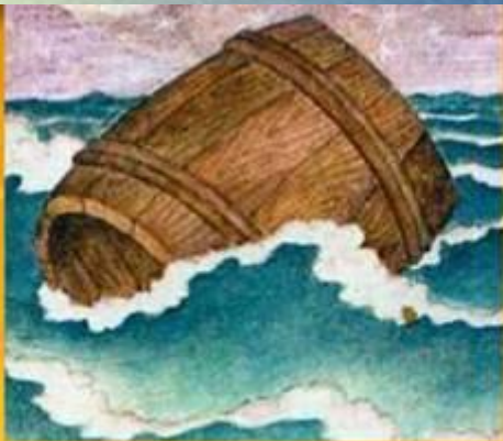
«Сказка о царе Салтане...»

Воспитатель отмечает, что Пушкин написал много сказок и читает детям «Сказку о царе Салтане». Педагог обращает внимание детей на морской сюжет из сказки, на красоту моря и предлагает послушать релаксацию бушующего моря.