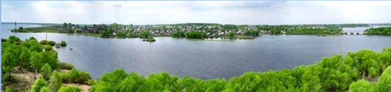
Молога – левый приток Волги