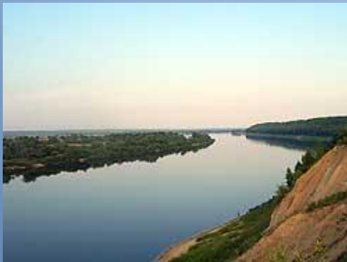
Ока – правый приток Волги