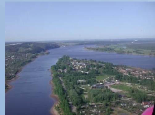
Место слияния Волги и Камы