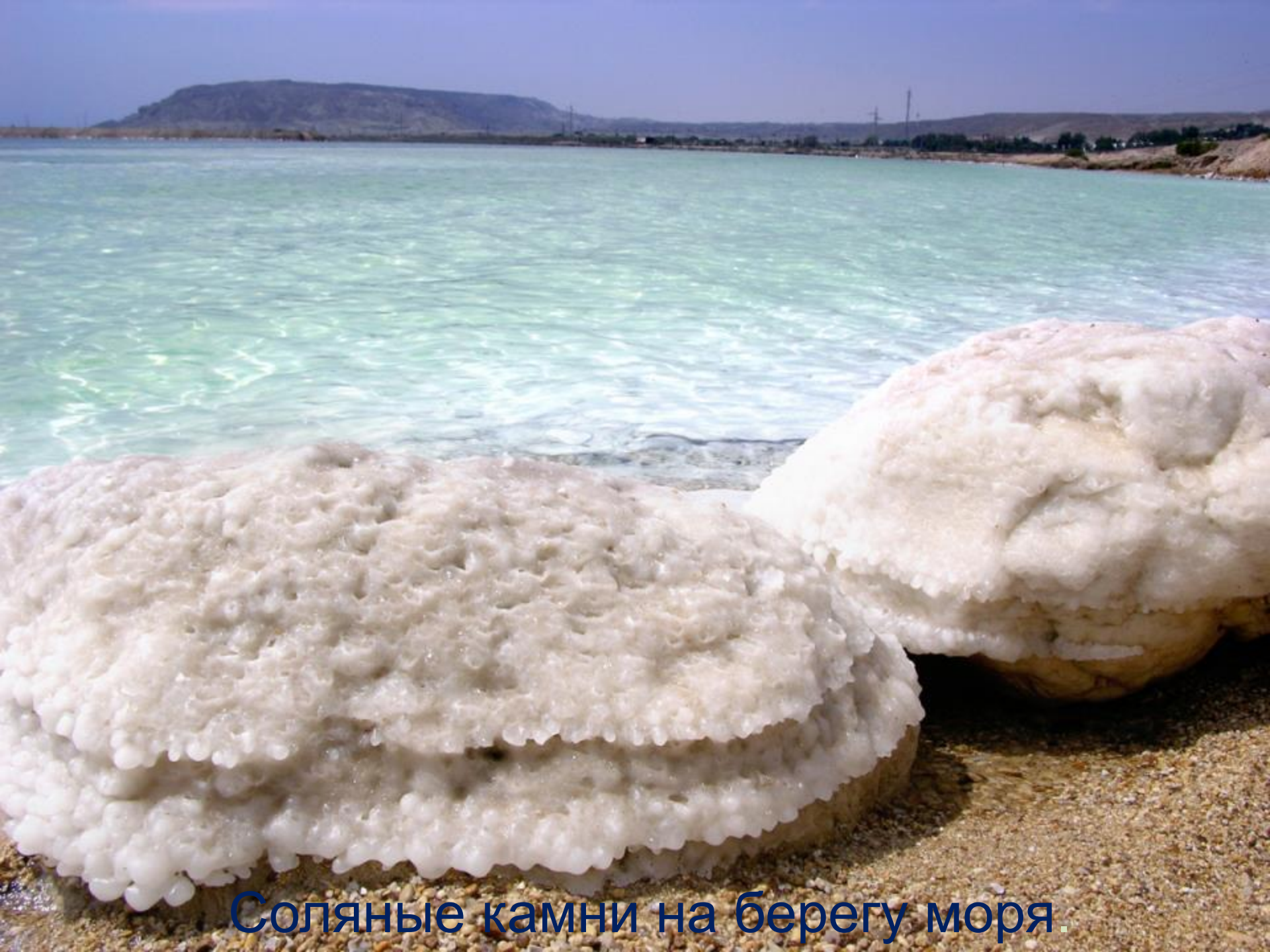
Соляные камни на берегу моря.