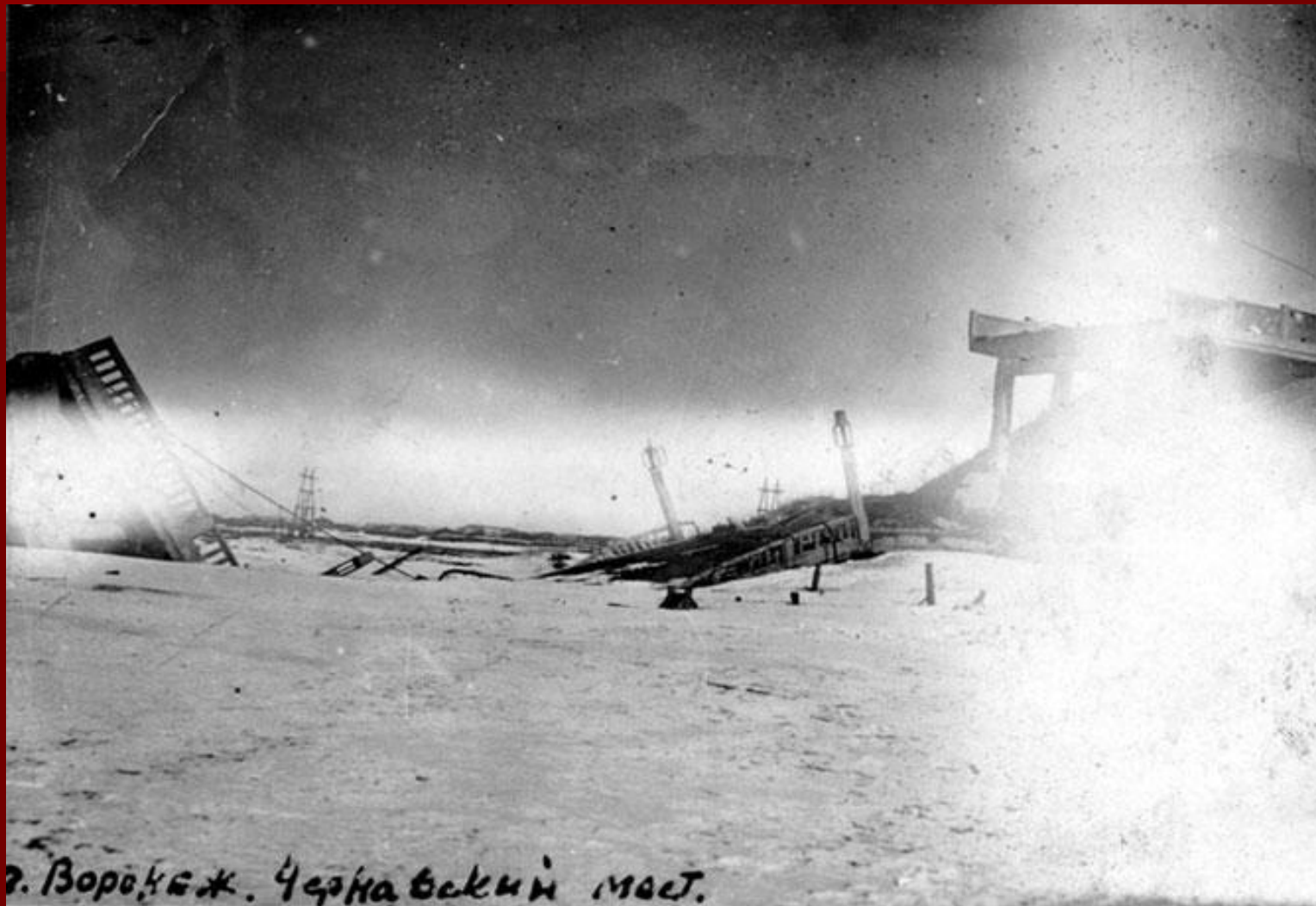
г. Воронеж. Чернавский мост.