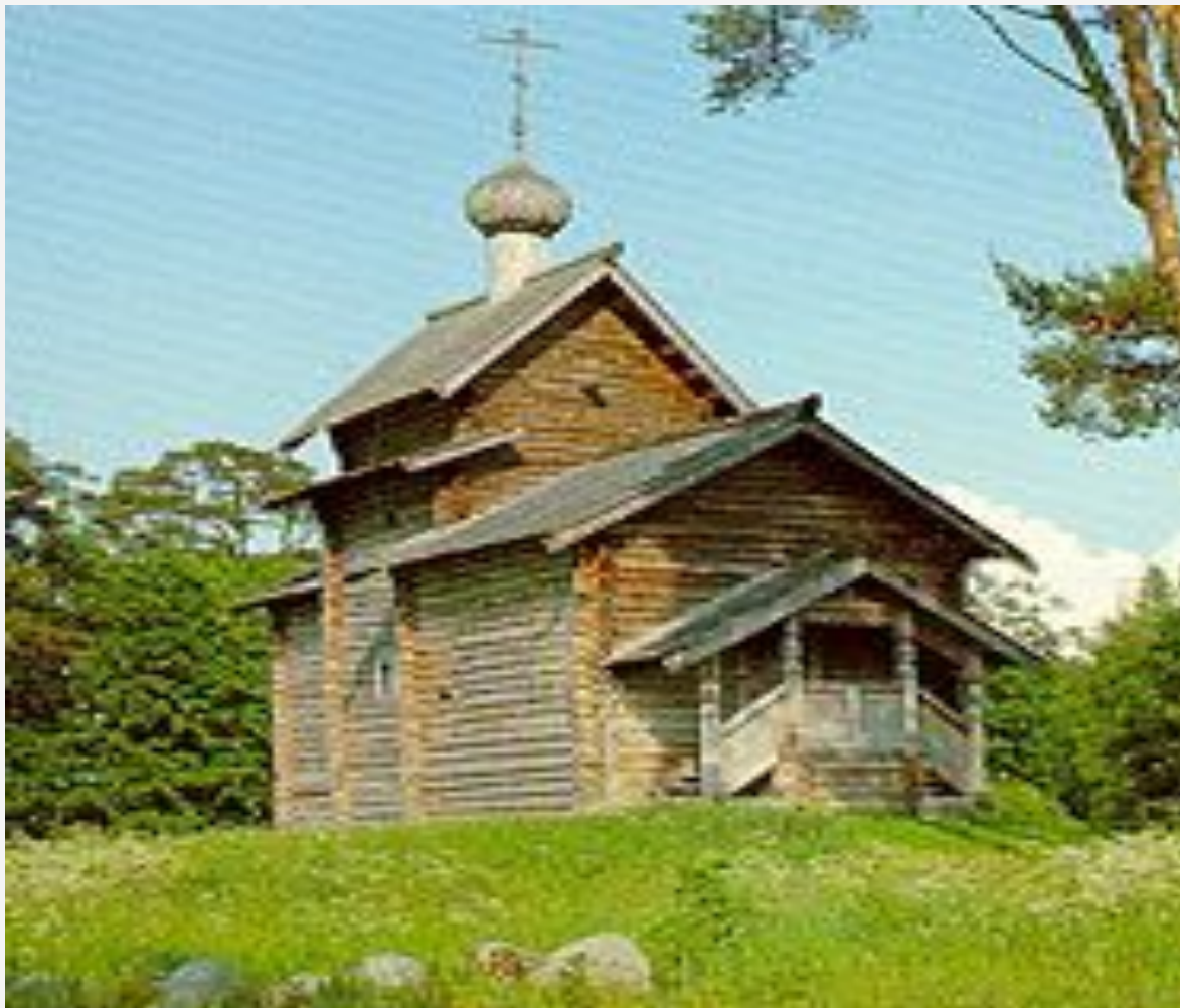
Деревянная церковь близ Новгорода.