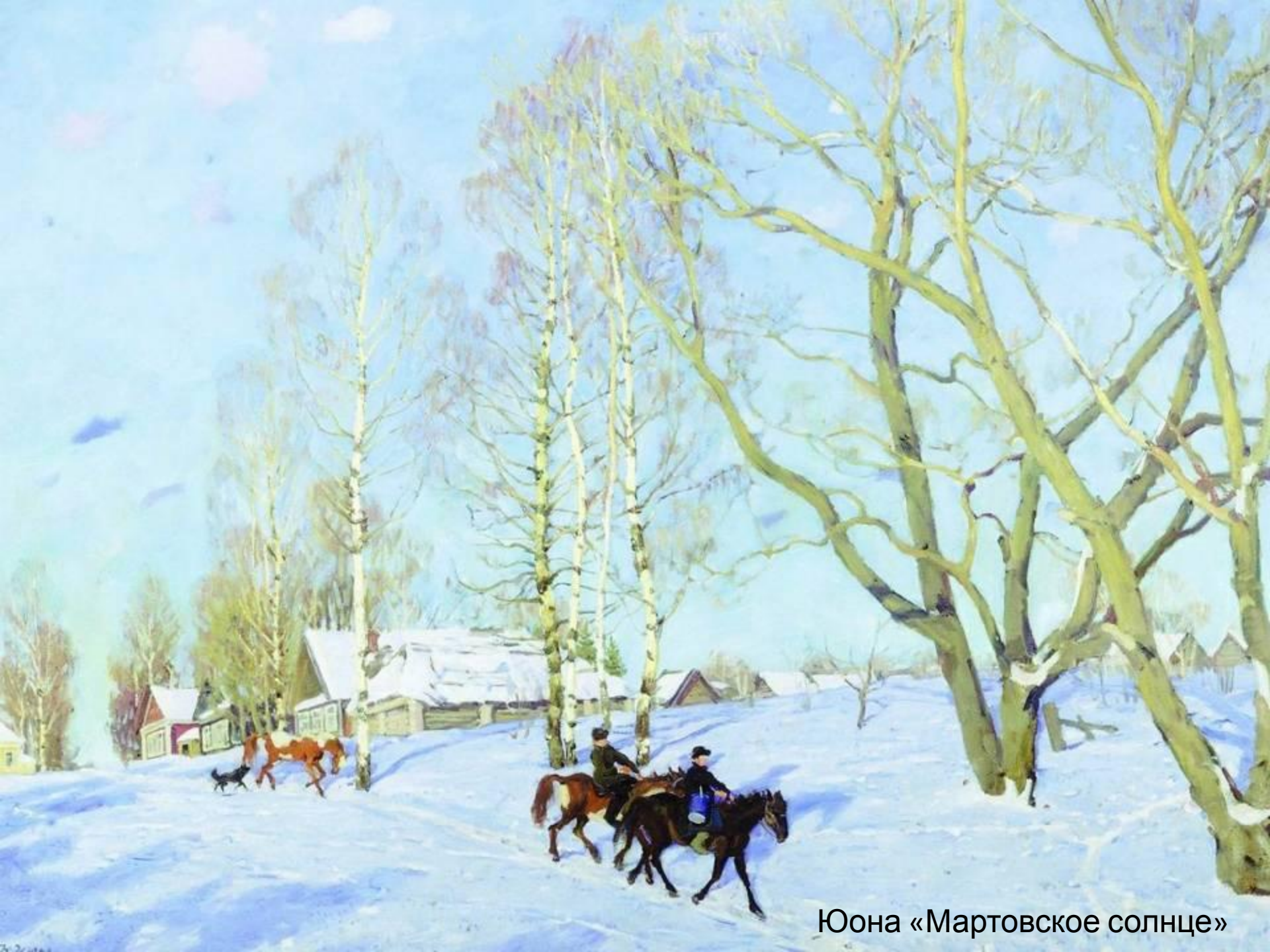
Юона «Мартовское солнце»