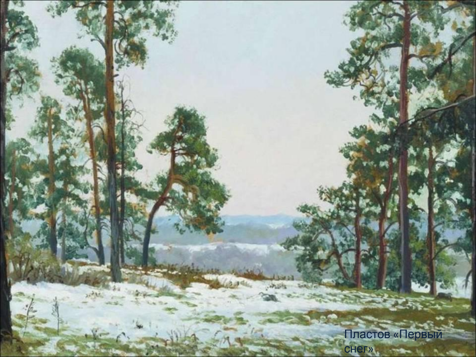
Пластов «Первый снег»