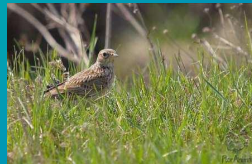
Жаворонок – в 2-3 ч утра