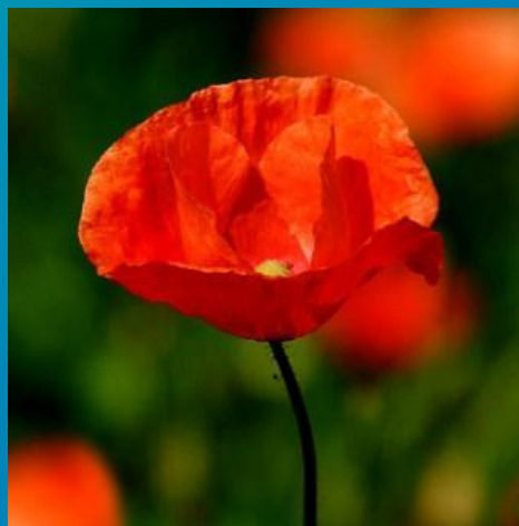
Мак – 5 часов утра