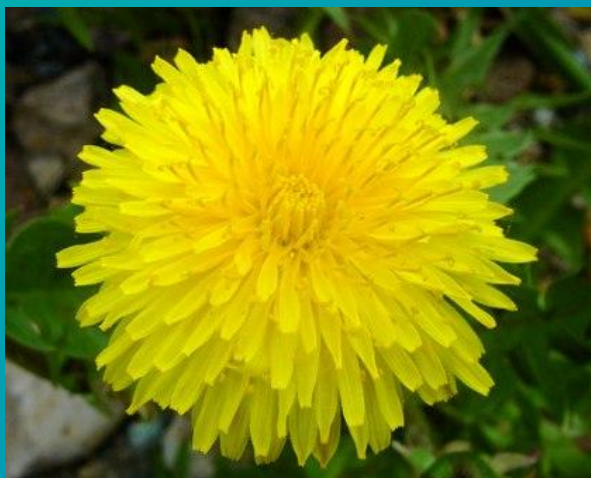
Одуванчик – 6 часов утра