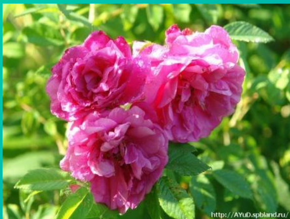
Шиповник – 4-5 часов утра