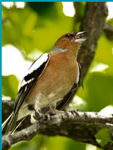
Соловей – в 2 часа утра