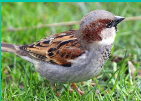
Воробей – в 6 ч утра