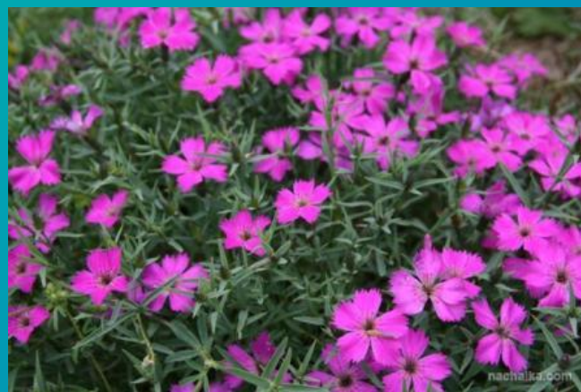
Полевая гвоздика – 9 часов утра