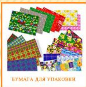
БУМАГА ДЛЯ УПАКОВКИ