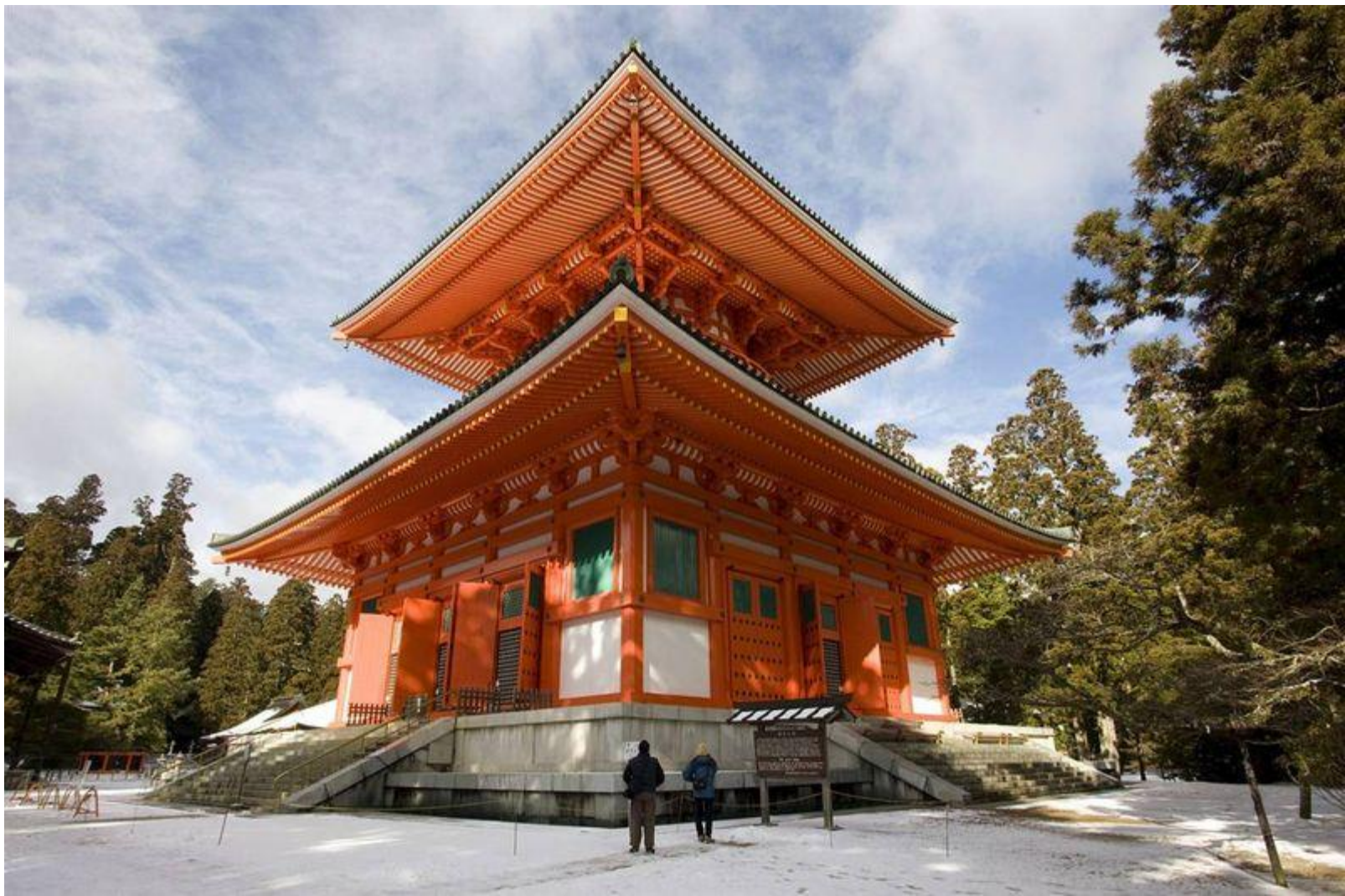
Буддийская пагода Компон-дайто на горе Коя, в провинции Вакаяма, Япония.