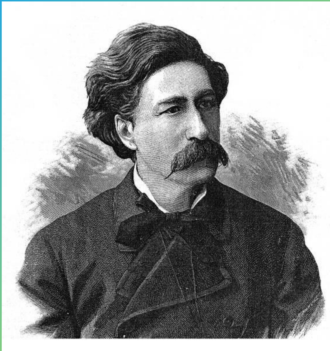
Худеков Сергей Николаевич