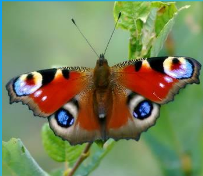
Дневной павлиний глаз