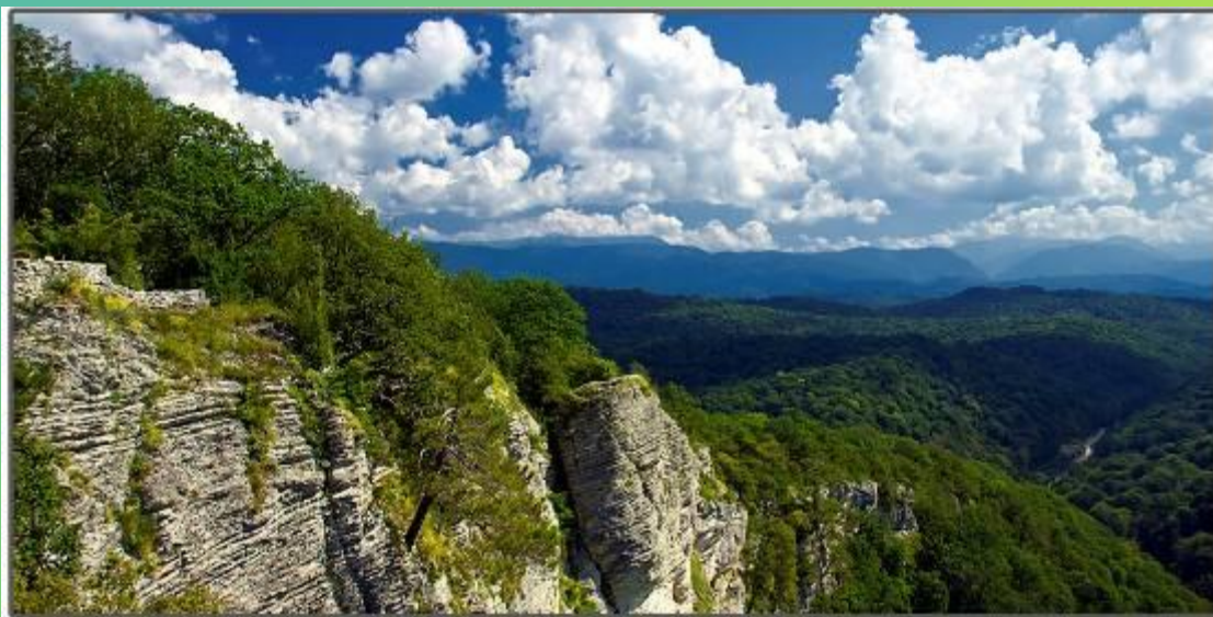
Национальный парк «Сочинский»