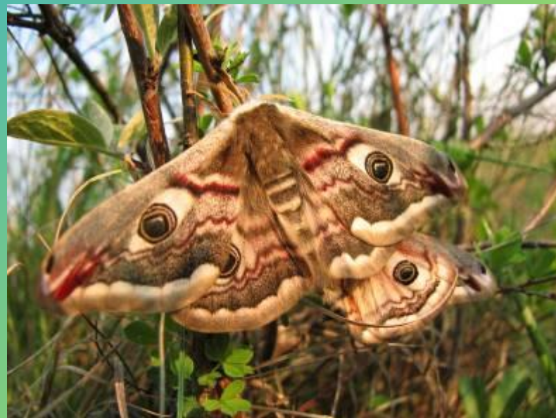
Ночной павлиний глаз