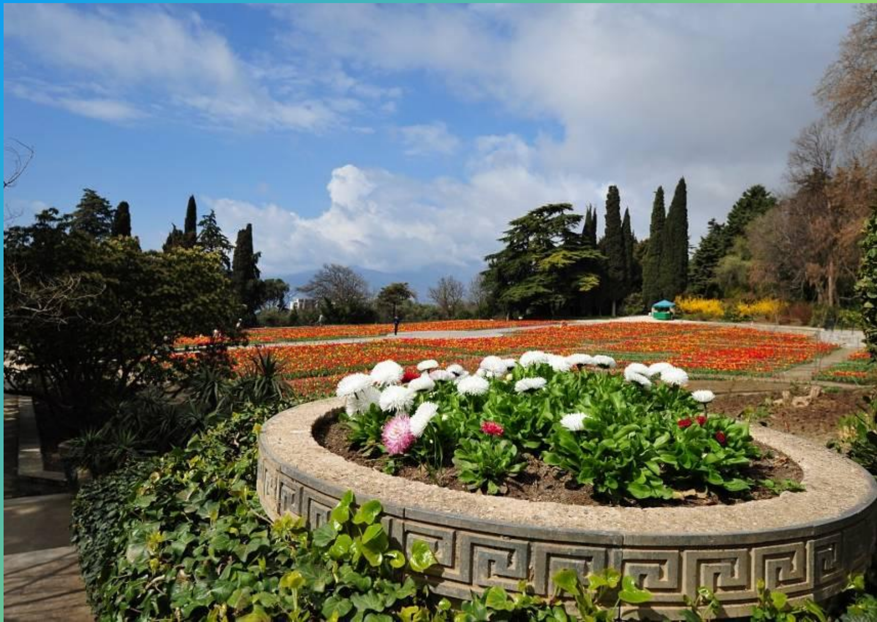
Никитский ботанический сад