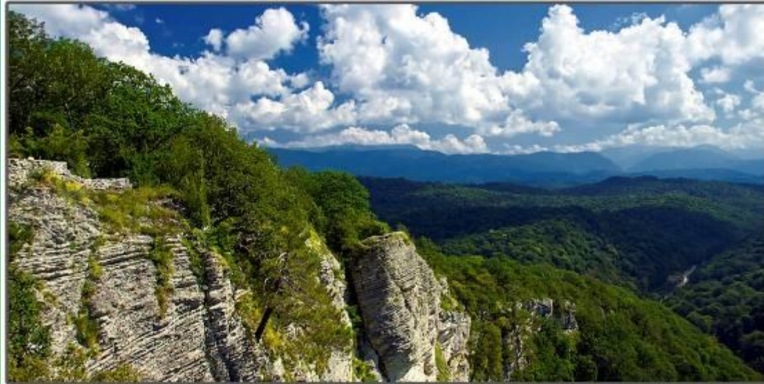
Национальный парк «Сочинский»