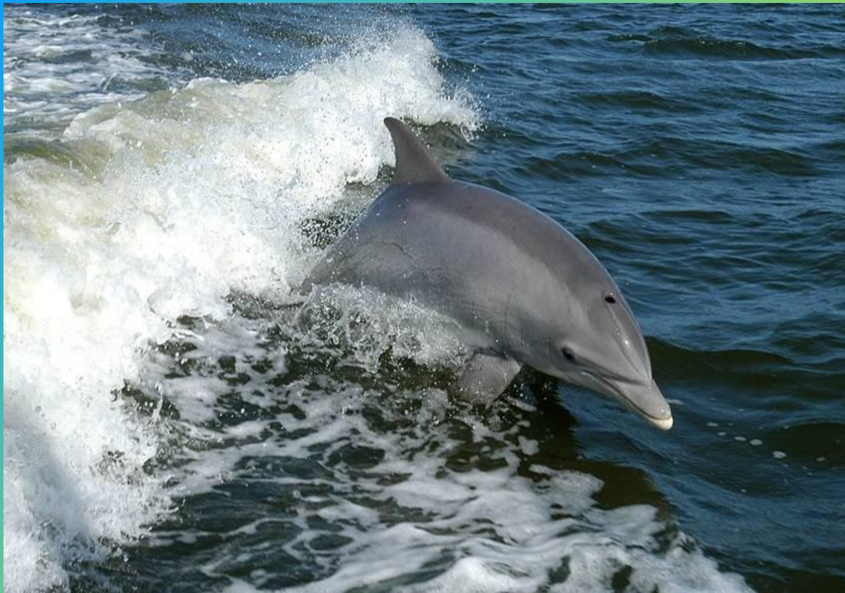
Дельфин черноморская афалина