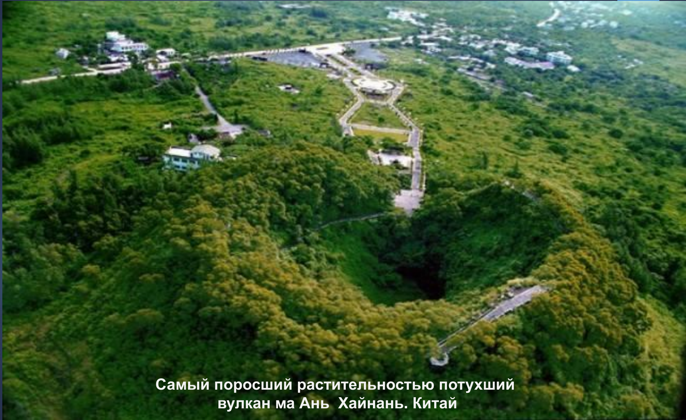
Самый поросший растительностью потухший вулкан ма Ань Хайнань. Китай