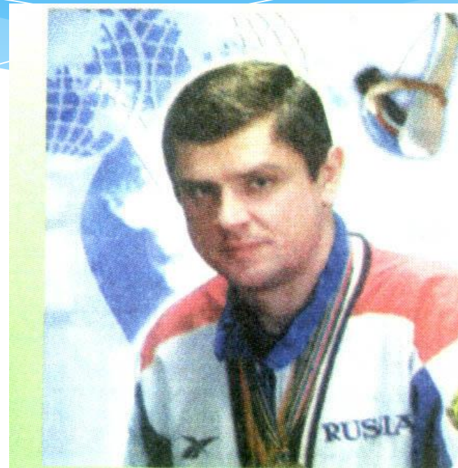
Москаленко Александр Занесен в книгу рекордов Гиннеса как самый титулованный батутист