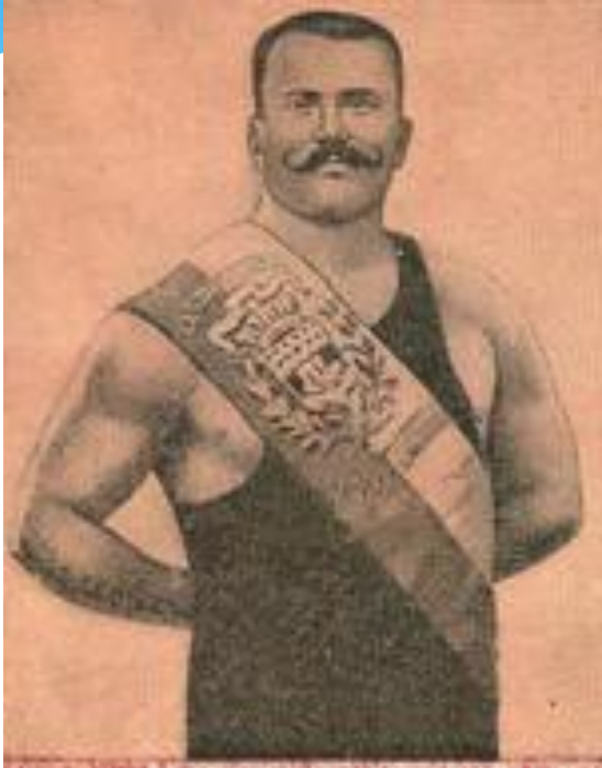
Иван Поддубный В начале XX века этого тяжелоатлета называли самым сильным человеком планеты