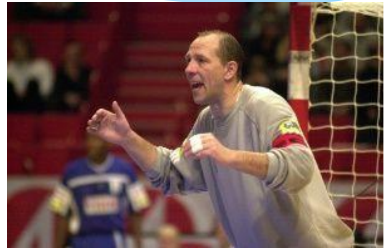
Андрей Лавров Гандболист, участник пяти Олимпиад, трехкратный олимпийский чемпион.