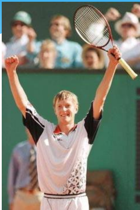
Евгений Кафельников Олимпийский чемпион на олимпиаде в Сиднее