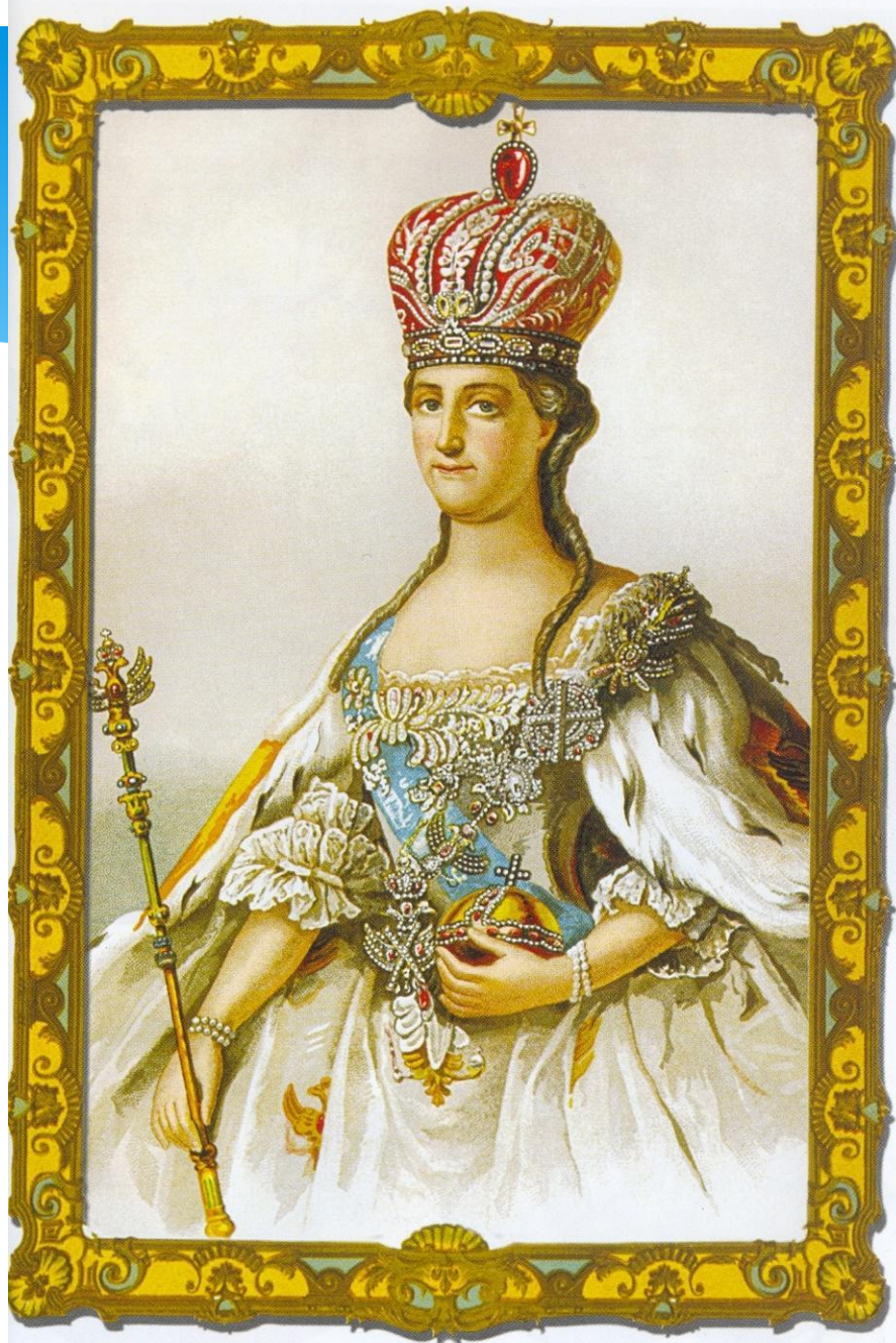
Императрица Екатерина II