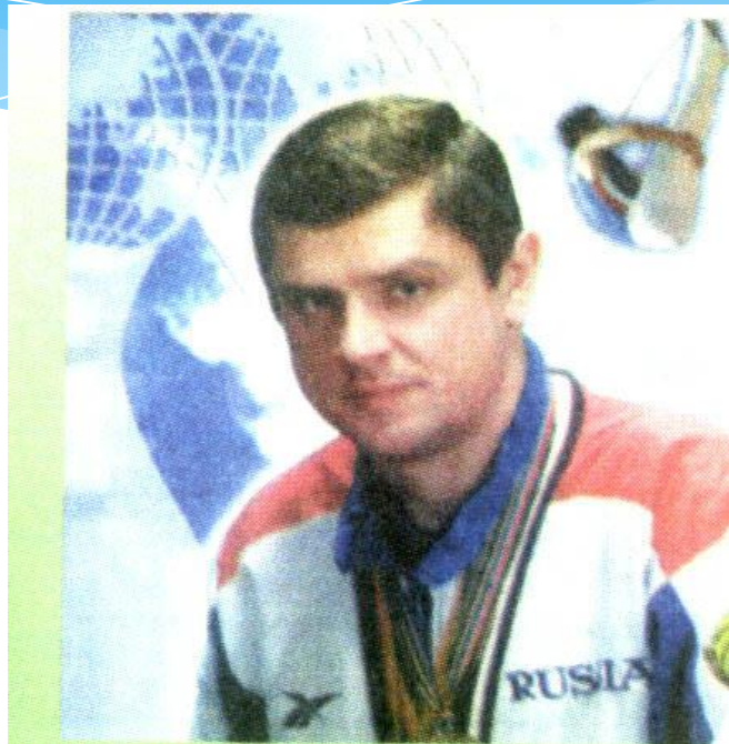
Москаленко Александр Занесен в книгу рекордов Гиннеса как самый титулованный батутист