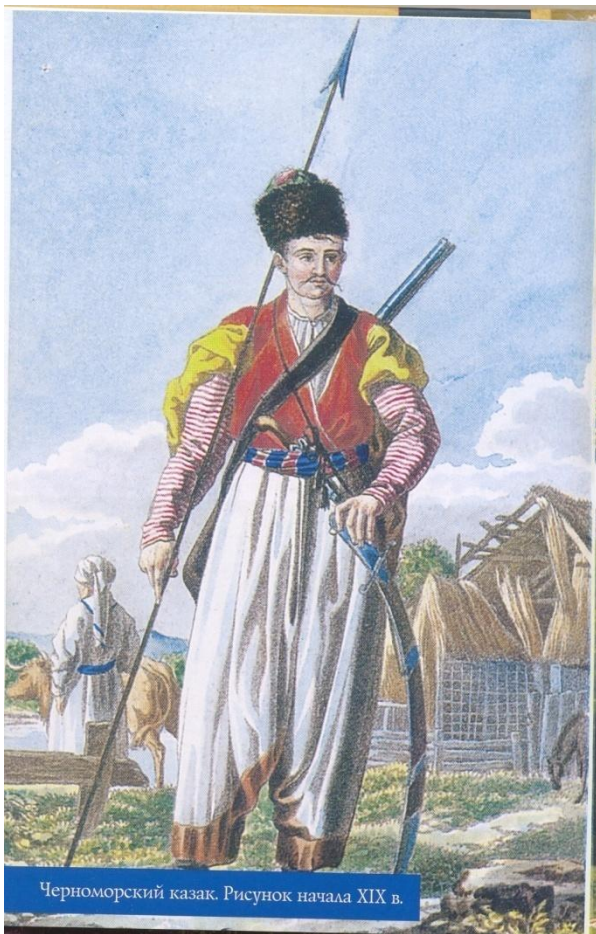
Черноморский казак. Рисунок начала XIX в.