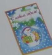
a postcard ['pəʊstkɑ:d]