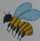
a bee [bi:]