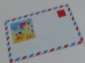
a letter ['letə]