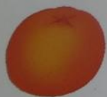
an orange ['ɒrɪndʒ]