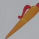
a pen [pen]