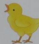
a chicken ['tʃɪkɪn]