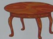
a table ['teɪbl]