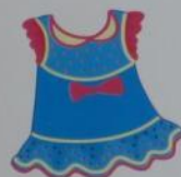
a dress [dres]