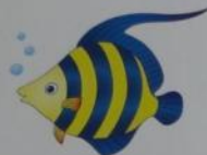
a fish [fɪʃ]