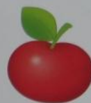
an apple ['æp(ə)]