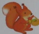
a squirrel ['skwɪr(ə)]