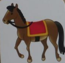
a horse [hɔ:s]