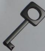
a key [ki:]