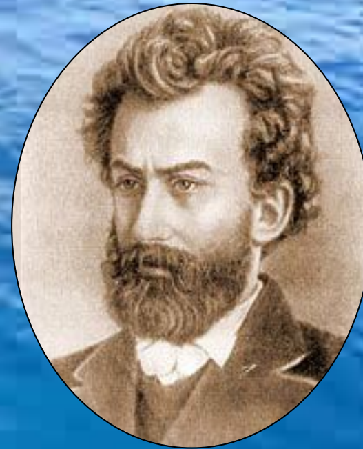
МИКЛУХО-МАКЛАЙ исследователь народов Юго-Восточной Азии и Океании