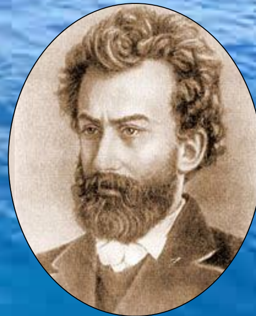
МИКЛУХО-МАКЛАЙ исследователь народов Юго-Восточной Азии и Океании