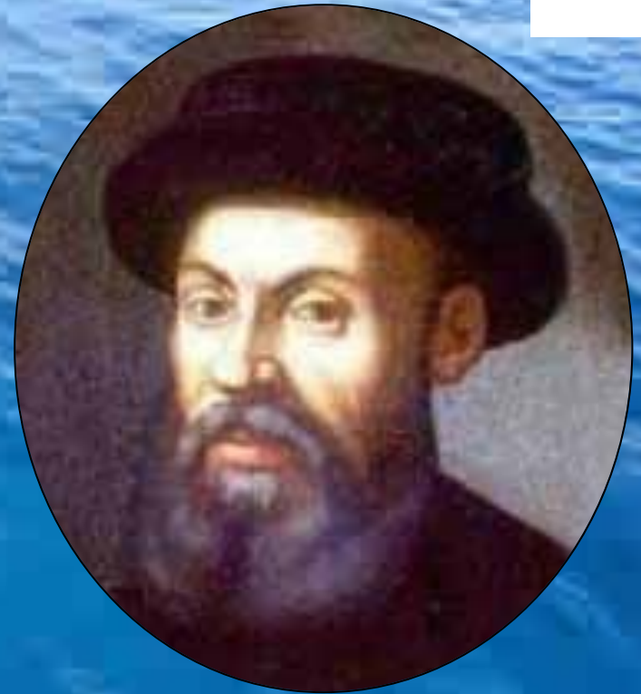
МАГЕЛЛАН открыл Тихий океан