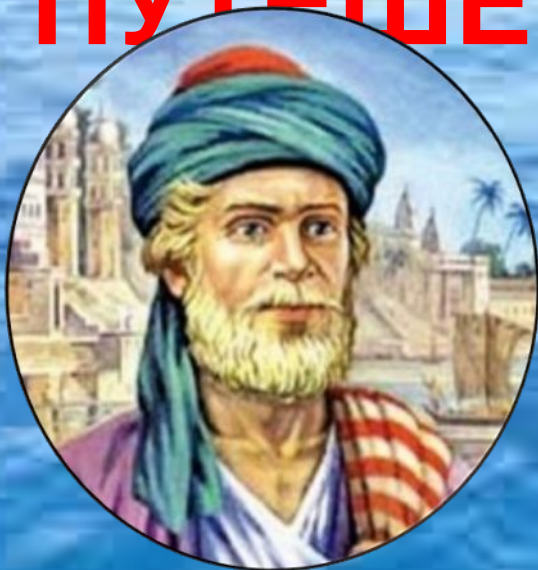
АФАНАСИЙ НИКИТИН описал путь в Индию